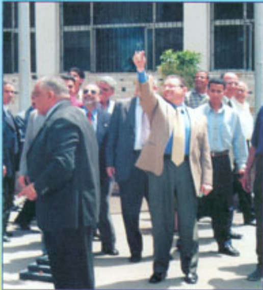
أ.د / رئيس الجامعة أثناء افتتاح مسابقة الماراثون بمعهد الكفاية الإنتاجية