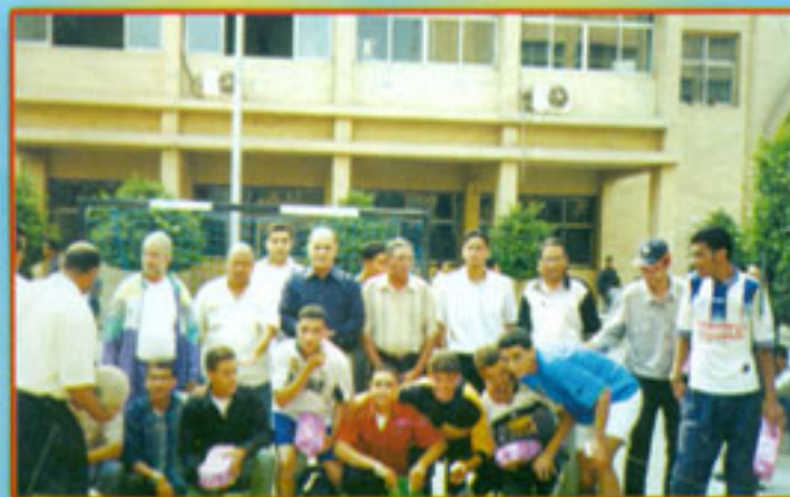
صورة تذكارية بمناسبة دوري الأسرىين طلاب المعهد