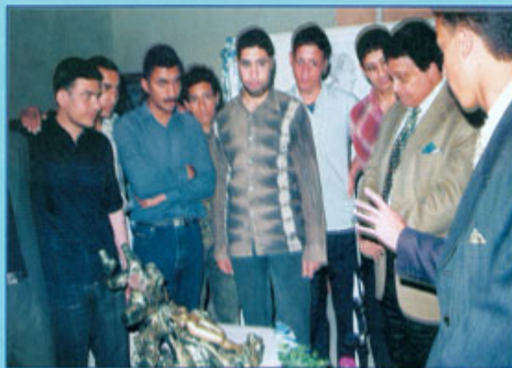
معرض الرسم والخطون التشكيلية