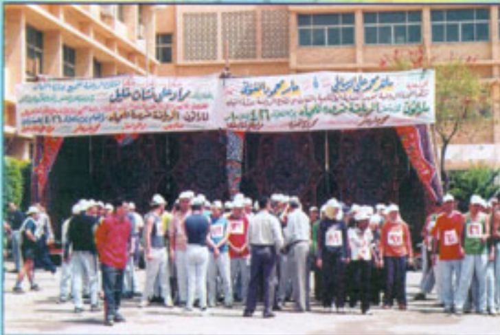
سباق الماراثون بمعهد الكفاية الإنتاجية