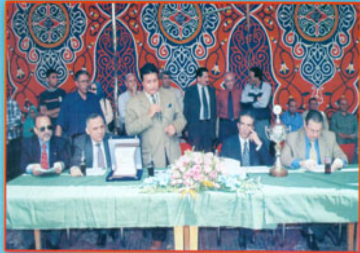
أ.د / عميد المعهد في صورة تذكارية بمناسبة ماراثون الشباب بالتعاون مع وزارة الشباب