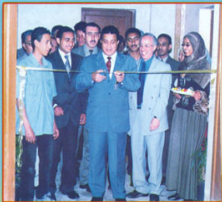
أ.د / عميد المعهد في صورة تذكارية بمناسبة إجراء مسابقة اللوحات الضخمة بالرسم