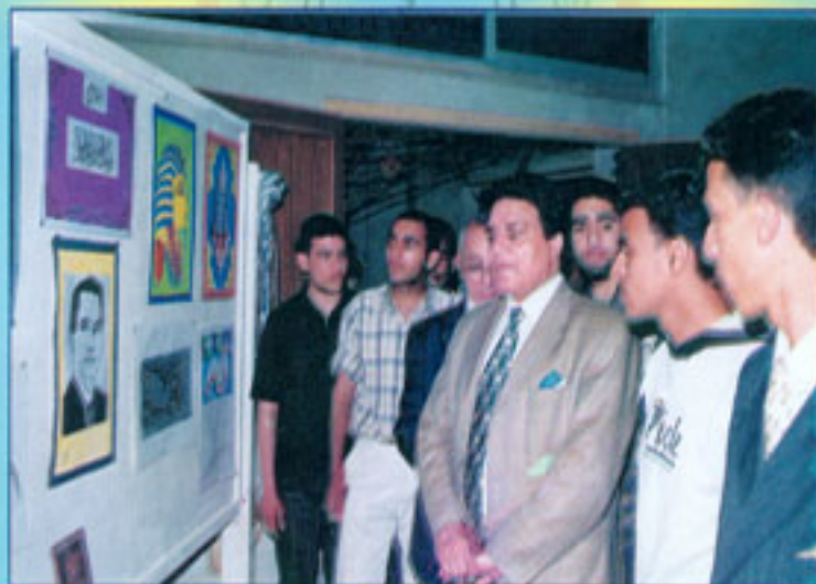
مسابقة الرسم والخط التشكيلي لطلاب المعهد