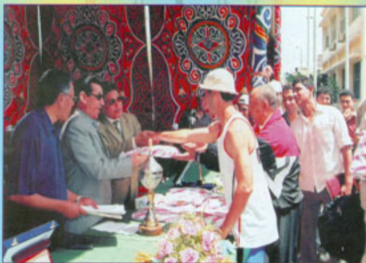
تسليم جوائز الماراثون