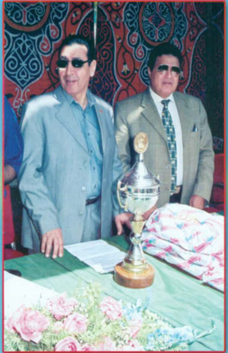
صورة تذكارية للأستاذ الدكتور / نائب رئيس الجامعة والأستاذ الدكتور / عميد المعهد في حفل تتصيب اتحاد طلاب المعهد للعام الجامعي ٢٠٠٤ / ٢٠٠٥م

جاديه في تحصيل العلم والمعرفة متوجيه هذا العام بالنجاح والتفوق مع أطيّب تمنياتنا لكم بالتفوق والساد ،