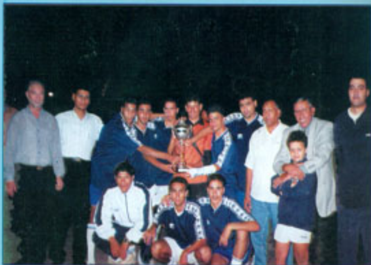
كأس رئيس الجامعة في الدورة الرضائية لخماسيات كرة القدم