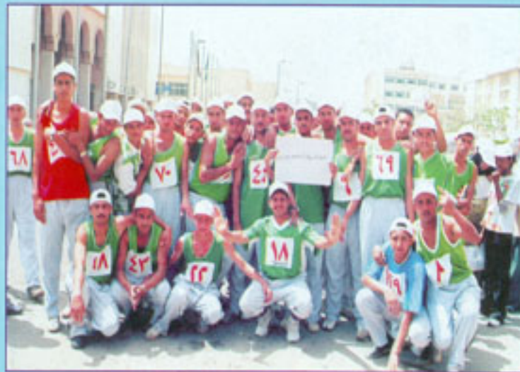
صورة جماعية لطلبة الجامعة لسباق الماراثون