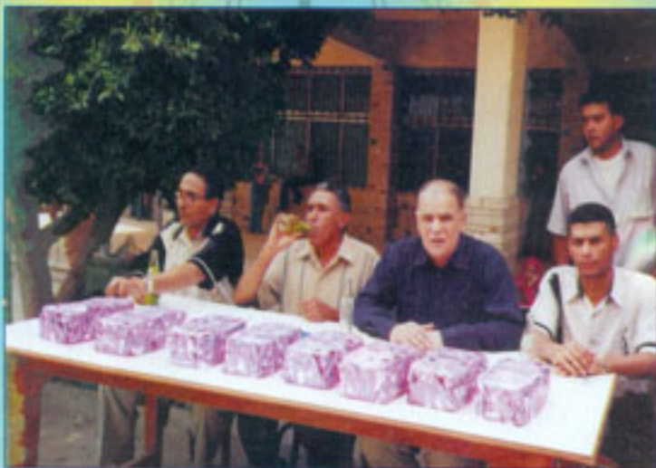
تسليم جوائز دورة كرة القدم وتنس الطاولة بالعيد