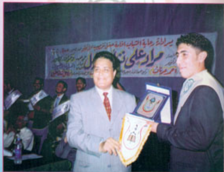
بمناسبة مسابقة الفن التشكيلي يرسم المعهد