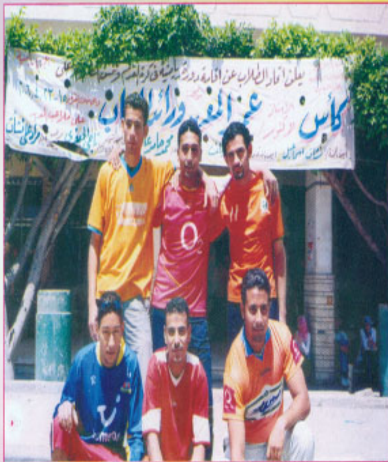
بمناسبة دورة كرة القدم وتنس الطاولة على كأس أ.د / عميد المعهد