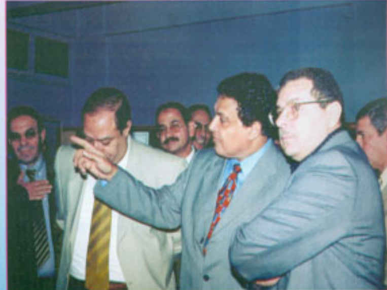
بمناسبة حفل تلمصب الاتحاد للعام الجامعي ٢٠٠٦م